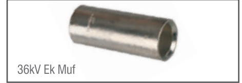
36kV Ek Muf