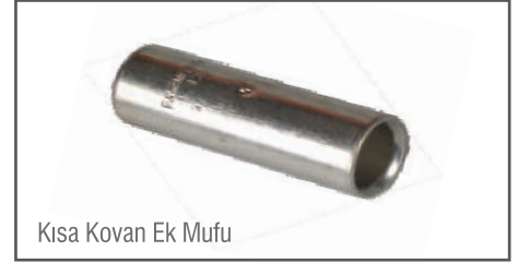
Kısa Kovan Ek Mufu